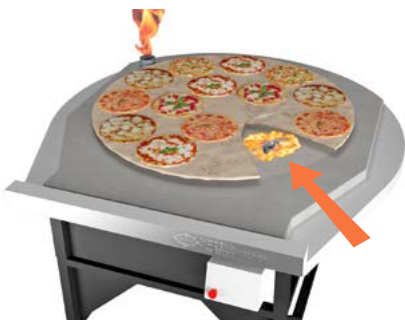
Sottopiastra Under-floor burner

With this control panel you can adjust the rotation speed by means of a potentiometer and reverse. You can also select the baking speed and the speed while you put pizzas into the oven